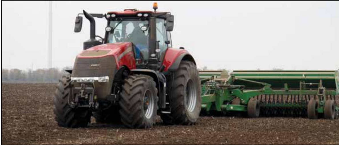
При добро натоварване сеитбеният агрегат е в състояние за 24 часа да засее от 850 до 1000 декара пшеница.

За настоящата година мога да кажа, че условията за сеитбата са много добри. Времето ни позволи да работим достатъчно дълго на полето, за да изведем агротехническите мероприятия в срок. Разбира се, влагата е все още оскъдна в почвата, но дългосрочните прогнози сочат валежи, което ни успокоява и няма място за притеснения. Всяка година е различна, характерна със своите особености, тази не прави изключение от останалите. Завършваме сеитбата за 12 календарни дни. Работим с един осемметров агрегат, с който е достатъчно при добро натоварване да засеем за 24 часа от 850