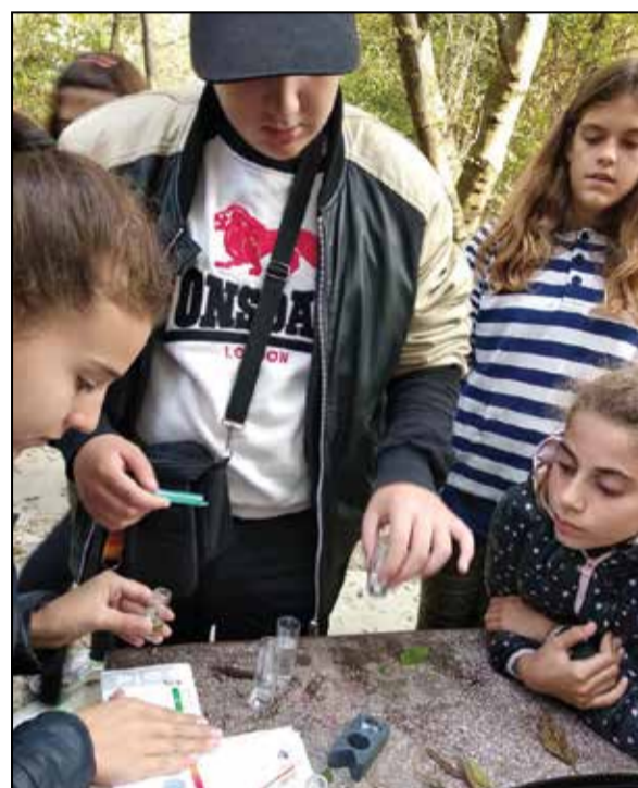
Членовете на „Екопулс“ разполагат с професионален комплект за изследване на сладка вода.