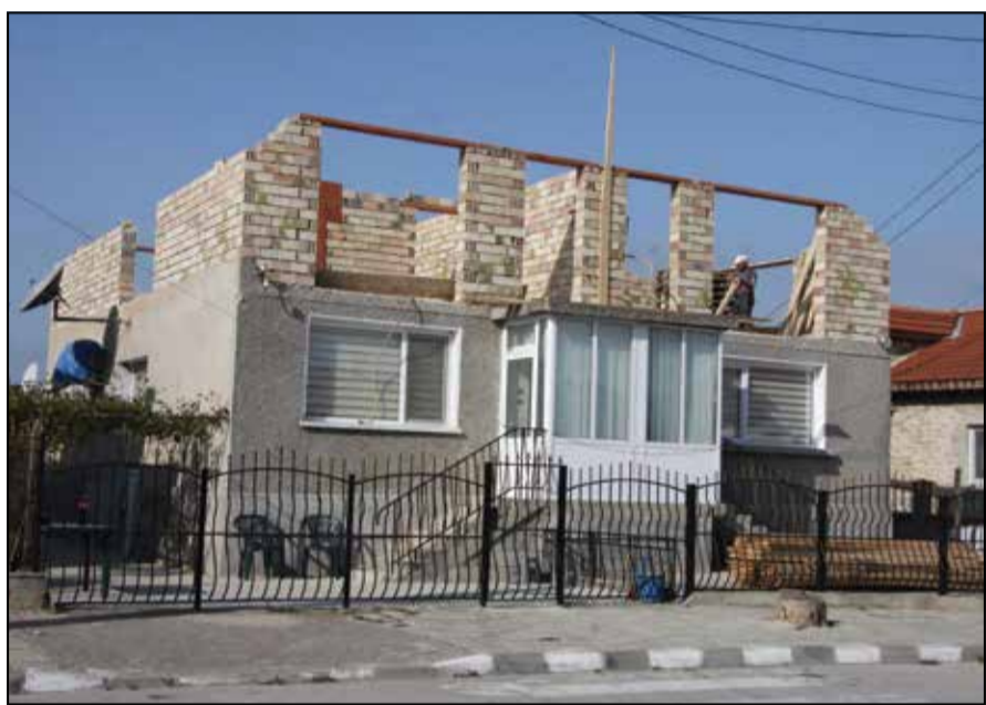
В кв. „Хаджи Димитър“ няма улица, на която да не се строи.

Не е тайна, че хората ни работят масово в чужбина. Седемдесет на сто от тях са в Полша, където имат регистрирани фирми и работят легално. Останалата част