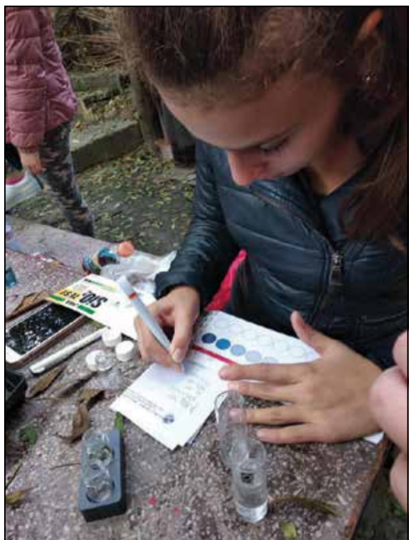
Комплектът за анализ на сладката вода разполага с таблица за сравнение и още на терена учениците виждат, че почти всички показатели са в рамките на нормалните стойности.

Клуб „Екопулс“ разполага с професионален комплект за изследване на сладка вода, доставен по проект на Предприятието за управление дейностите по опазване на околната среда (ПУДОС). Възпитаниците му изследват водата за амониум и фосфатни йони, нитрити, нитрати, киселинност и карбонати. Комплектът разполага с таблица за сравнение