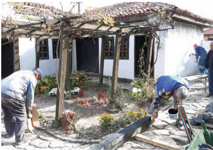
Работници привършват ремонта на сградите в Етнографския комплекс.

В Етнографския комплекс в едната сграда ремонтът на покрива вече е приключен, във втората се извършват довършителни дейности и в рамките на седмица и те ще приключат. Това, което стартира, като още един поет ангажимент, е демонтажът на стария котел на парната инсталация в Народно читалище „Съгласие“ и замяната му с нов. Ще се ремонтира, разбира се, и отоплител-