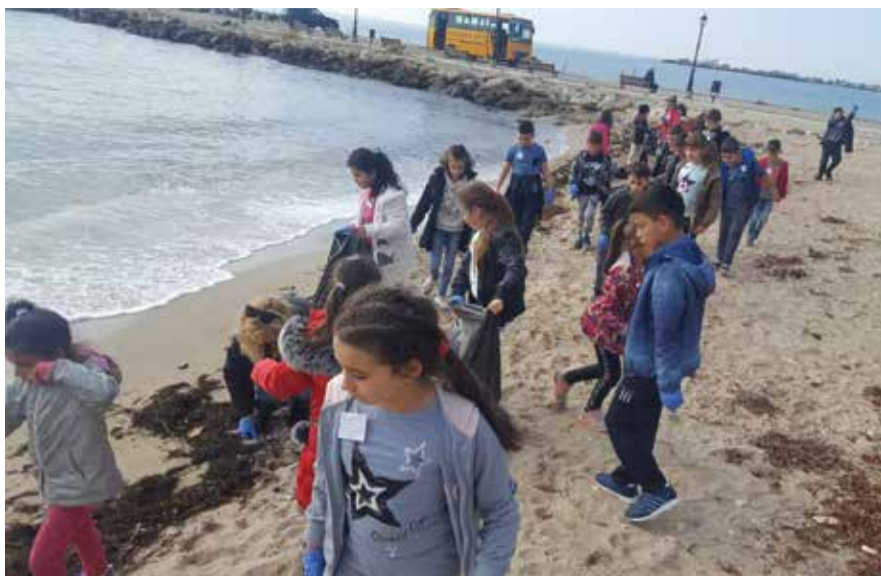
Второкласниците от СУ „Стефан Караджа“ почистиха плажната ивица в Каварна.

„Преди 22 години, на 31 отомври, шесте държави, които имат излаз на Черно море, са сключили споразумение за закрила и защита на Черно море. 16 мил. жители се хранят от Черно море, тяхното битие е свързано с морето. И ние решихме на този